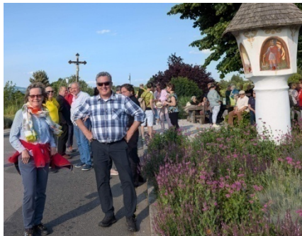
6.6. Dekanatswallfahrt nach Drobolach am Faakersee