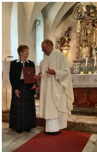
13.9.25 Großer Kirchenputztag