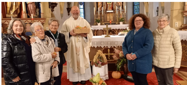
5. Oktober 2025 Erntedankmesse in Kreuth