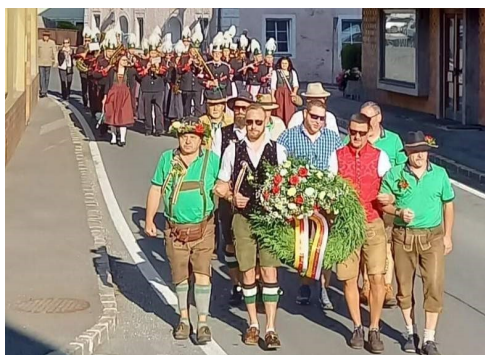
24.8.2025 Kirchtag in Bad Bleiberg