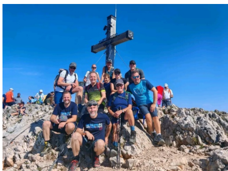
15.8.2025 Maria Himmelfahrt – Kirchtag am Dobratsch Die Hl. Messe fand um 11 Uhr in der Kirche „Maria am Stein“ statt.