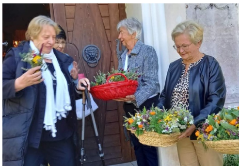
31.8.2025 Kräutersegnung in Kreuth