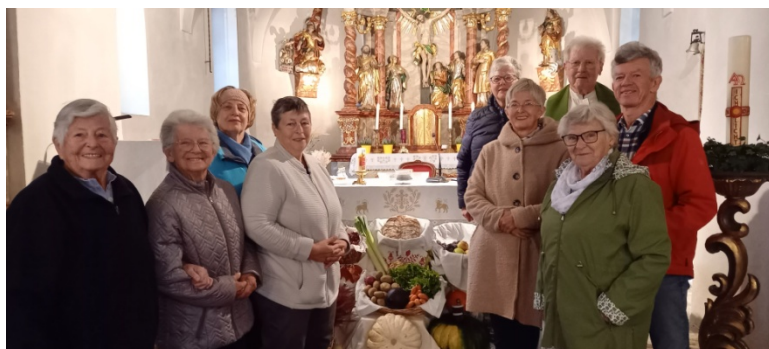
Erntedankfeier in Bad Bleiberg 12.10.2025