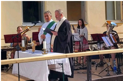
Kirchtag in Kreuth am 13.7.